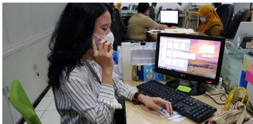
CV Tola Bakti Kencana

Jumlah Perusahaan yang Diberikan Asistensi Via Online Sebanyak 3 Perusahaan