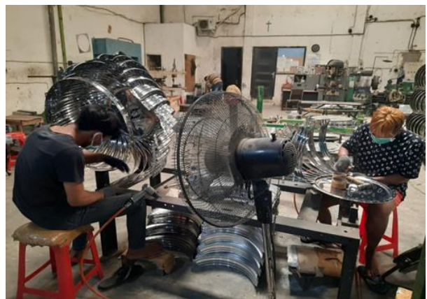
Perorangan Lestarindo Abadi Jalan Gunung Anyar Tambak IV No.42 Kav. 78-80