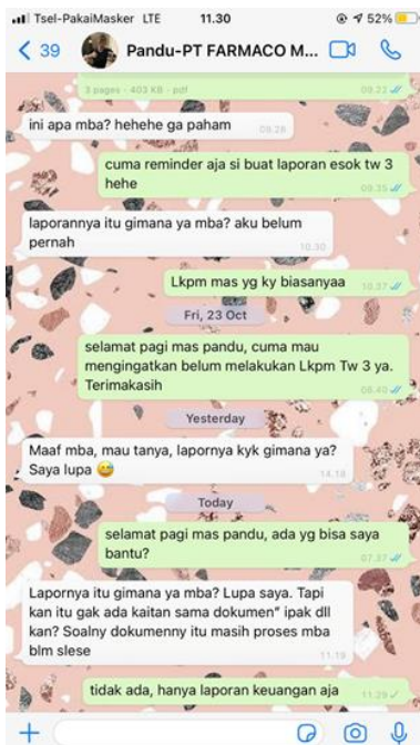
PT Farmaco Medika