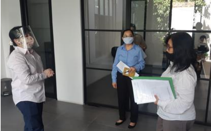
PT Bon Ami