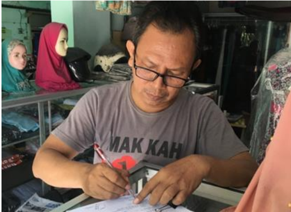
PT Delta Enindo Tama Jl. Mulyorejo No. 62