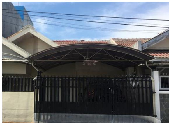
CV Coco Kairos Jl. Babatan Pantai Utara IX/10