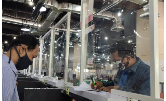
Pelayanan Loker Pengambilan