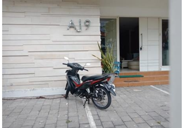
Jl. Rungkut Mejoyo Selatan Blok AJ 9