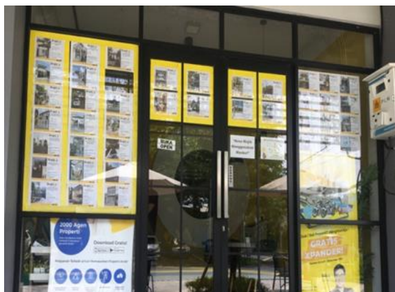
PT Kasih Karunia Mandiri Jl. Babatan Pantai Utara 2