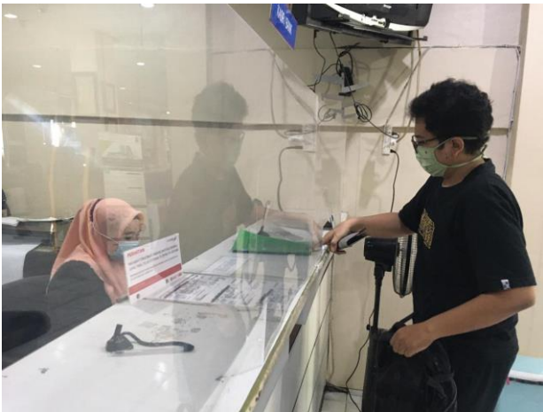
Pelayanan Locket Bank Jatim