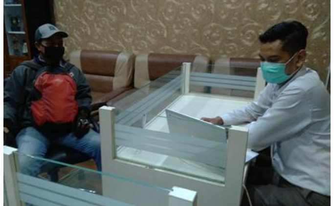
PT Aspindo Mutual

Jumlah Perusahaan yang Diberikan Asistensi Sebanyak 2 Perusahaan