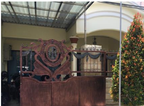
PT Royal Lestari Mandiri Jl. Mulyosari Utara