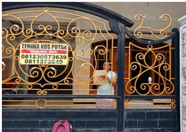
Jl. Rungkut Mejoyo Selatan III No. 3 Blok N 39