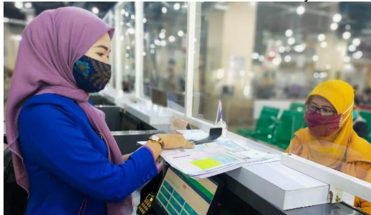
Pelayanan Loker Customer Services

Jumlah Permohonan Perizinan Yang Masuk Sebanyak 105 Berkas