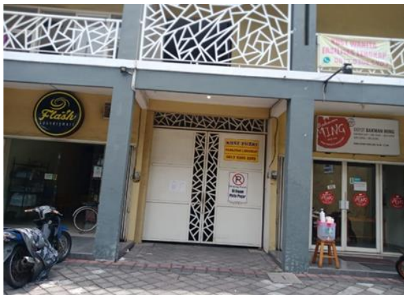
Jl. Rungkut Mejoyo No. 12 Blok G-6