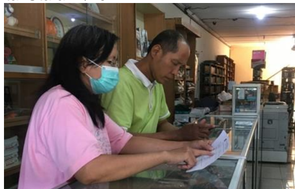
UD D'Story Jl. Mulyosari Raya 53