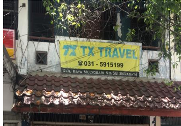
UD Anugrah Jaya Jl. Mulyosari Raya 58