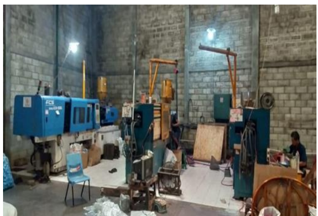
Perorangan Anugerah Sejahtera Jalan Gunung Anyar Tambak IV No. 12 Kav.159 -160