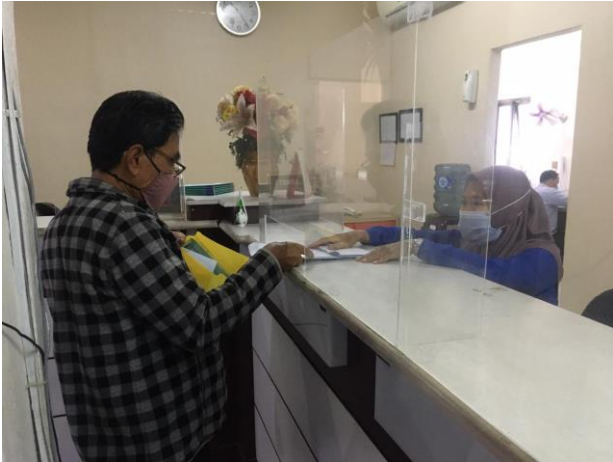
Pelayanan Locket Customer Service