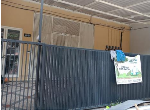
Jl. Rungkut Mejoyo Utara VIII No. 22 Blok AC 11