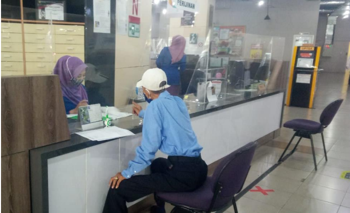
Pelayanan Loker Informasi