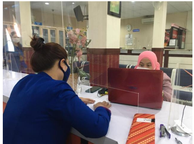
Pelayanan Locket Informasi

Jumlah Permohonan Perizinan Yang Masuk Sebanyak 84 Berkas