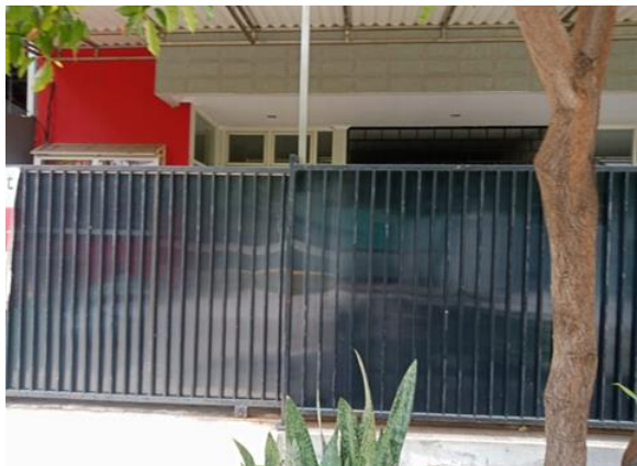
Jl. Rungkut Mejoyo Selatan I No. 49 Blok AJ 11