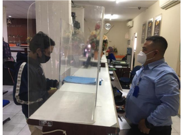
Pelayanan Pelayanan Dinas Kesehatan